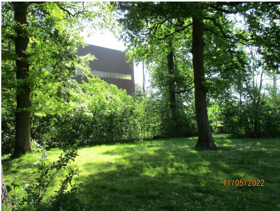
Blick aus der Parkanlage nach Osten auf die Bestandshalle, an die der Anbau erfolgen wird