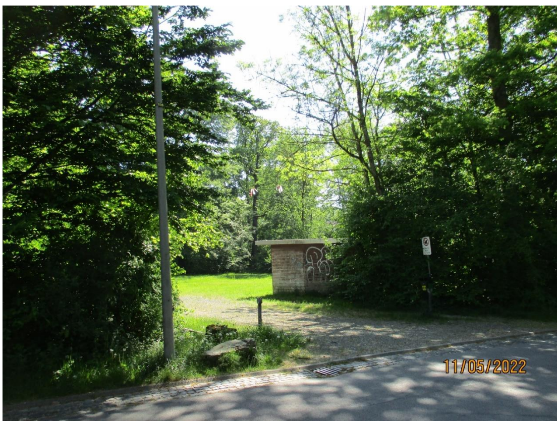
Blick in das Plangebiet von der „Wiedenbruchstraße“, vorhandene Bebauung