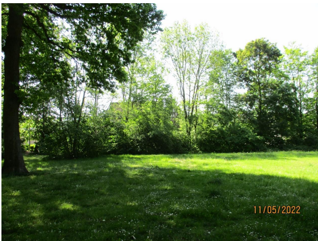
Blick aus dem Plangebiet auf den Gehölzstreifen entlang der Straße „Am Stadtwald“