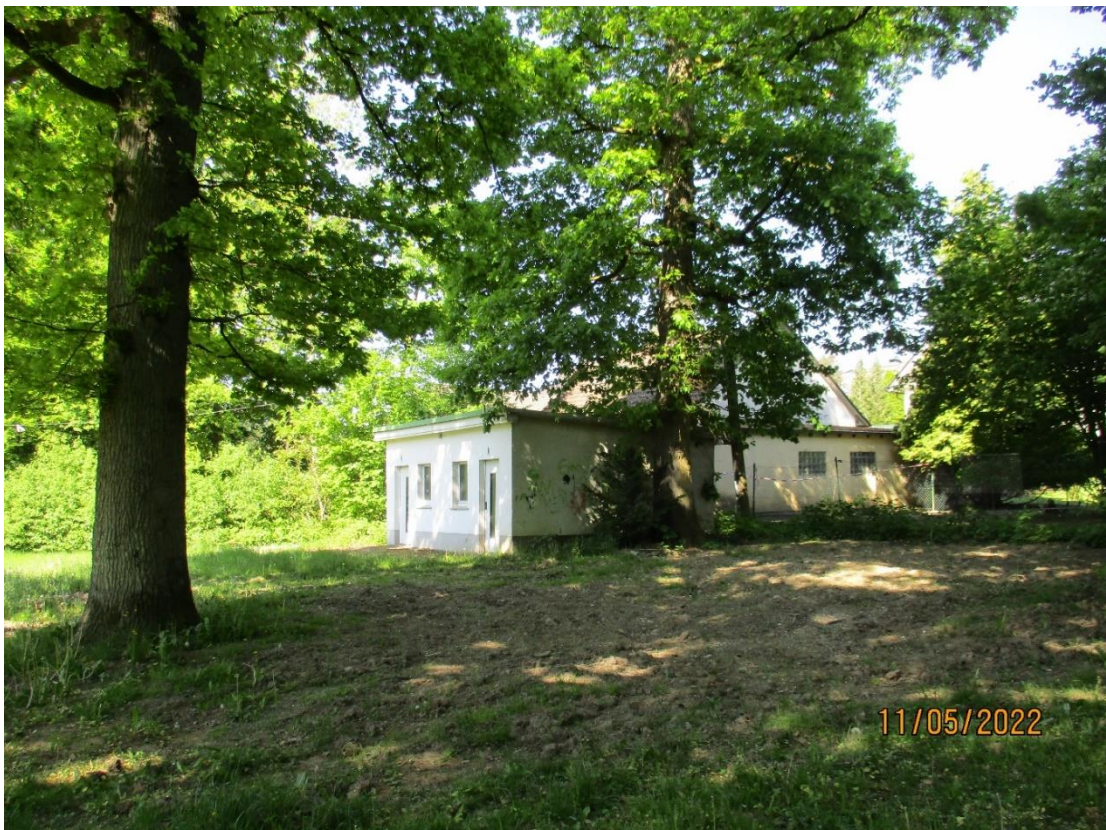
Blick Richtung Norden, Bebauung im Plangebiet, angrenzend Mischnutzflächen