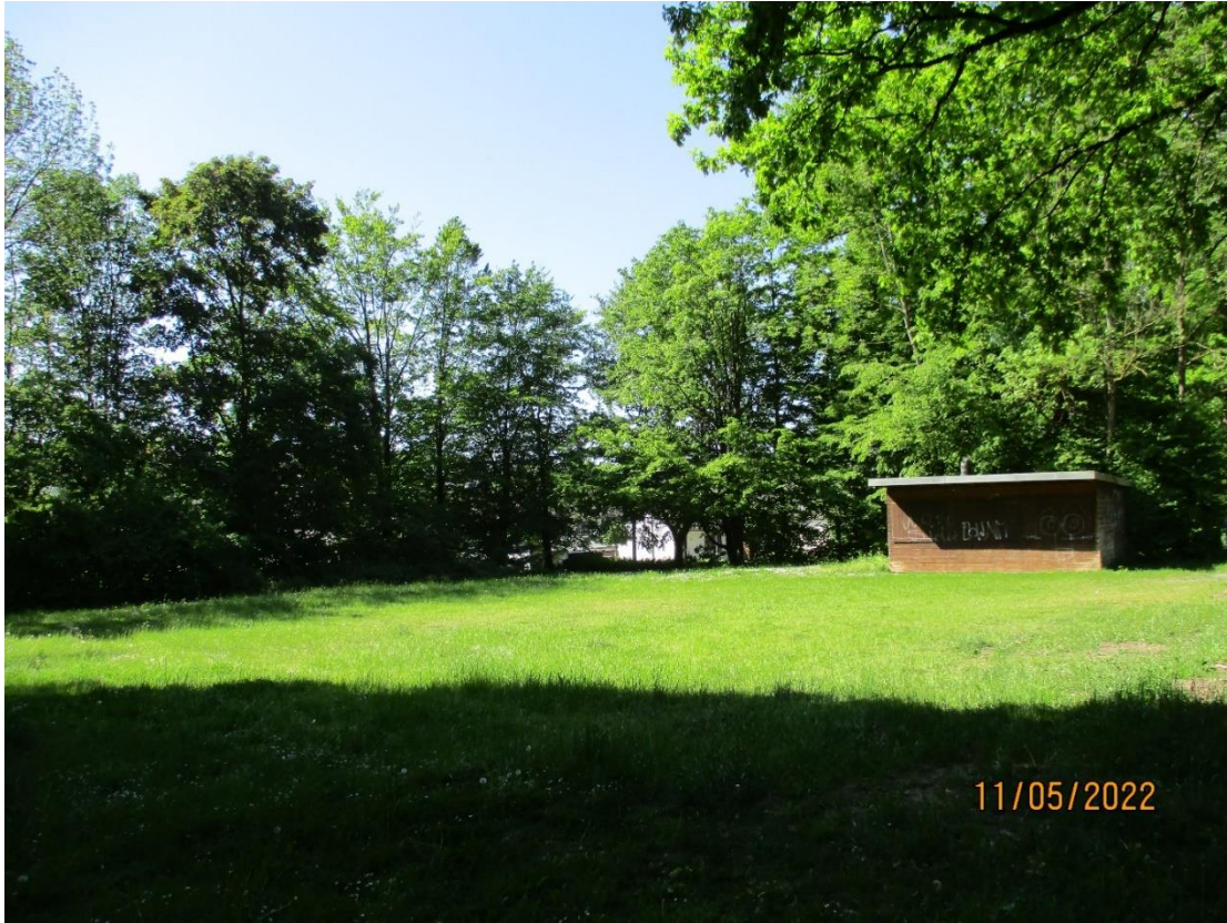
Blick aus der Parkanlage Richtung „Wiedenbruchstraße“