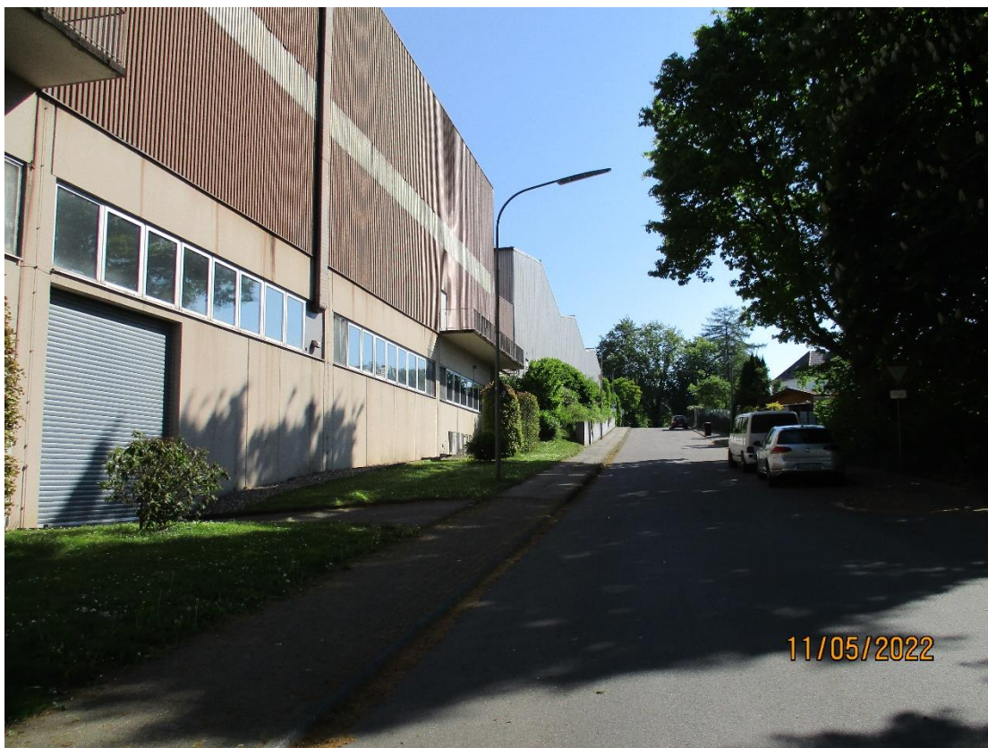
Straße „Am Stadtwald“ mit Blick Richtung Osten, links die Firma GIZEH