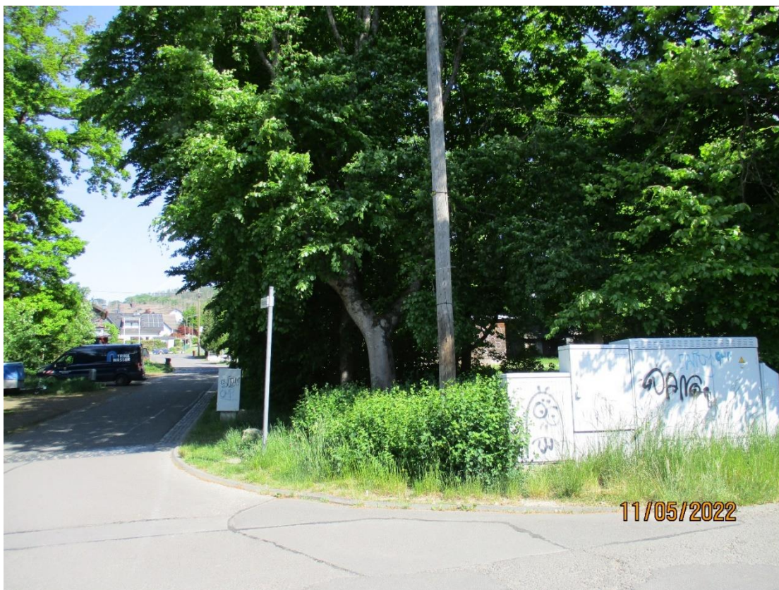
Blick von der Straße „im Stadtwald“ in die „Wiedenbruchstraße“, rechts das Plangebiet