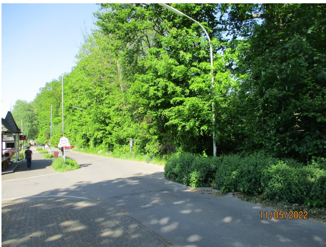
Straße „Am Stadtwald“ mit Blick Richtung Westen, rechts die Parkanlage (Plangebiet)