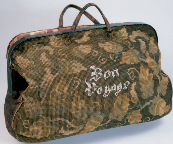
Reisetasche, 1. Hälfte 19. Jh.

Ausschnitte historischer Postkarten um 1900