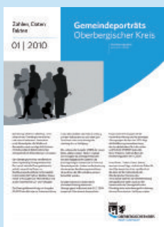
Zahlen, Daten, Fakten Ausgabe 1/2010 Gemeindeporträts Oberbergischer Kreis