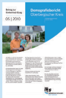
Beitrag zur Kreisentwicklung Ausgabe 5/2010 Demografiebericht Oberbergischer Kreis